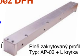
Plně zakrytovaný profil Typ: AP-02 + L krytka